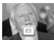
17.11.2009 Oskar Lafontaine: Rückzug aus der Politik?